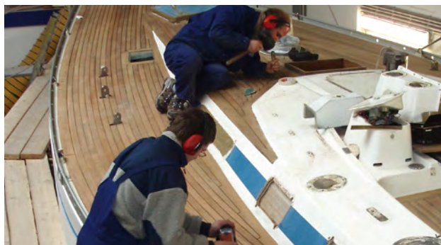
Unser Handwerk vereint Präzision ...

Substanzerhaltung ist im Bootsbau unentbehrlich, alles Weitere ist ausbaufähig bis hin zu Exklusivem. Ob Umbauten oder ein neues Teakdeck – mit guten Ideen, ausgewählten Materialien und handwerklichem Geschick wird bei uns aus Ihrer Vorstellung genau die Yacht, an der Sie viele Jahre Ihre Freude haben.