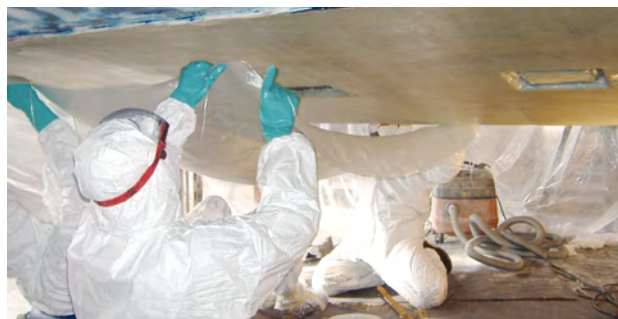
... und Innovation.

Ob Erneuerung des Teakdecks, Modernisierung der Innenausstattung, der Pantry oder gar eine Komplettsanierung – mit uns können Sie Ihre Wünsche für exklusives Flair an Bord verwirklichen.