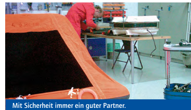
Mit Sicherheit immer ein guter Partner.

Mit Sicherheit bestens ausgerüstet. Auch wenn ein römisches Sprichwort besagt, dass man vor Gericht und auf hoher See in Gottes Hand sei („Coram iudice et in alto mari sumus in manu Dei“), so sorgen wir gern für geprüfte Sicherheit an Bord Ihrer Yacht. Damit Sie sich auf See mehr als nur in guten Händen wissen.