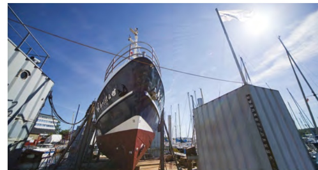
Manches sehen wir aus ganz anderer Perspektive.

Von Berufs wegen seetauglich. Schon seit Generationen ist die Böbs-Werft die feste Anlaufadresse für die gewerbliche Schifffahrt in der Lübecker Bucht. Wartung, Reparatur, Umbau