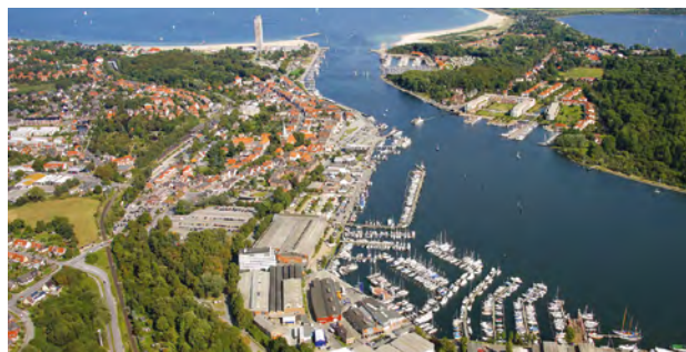
Ein Standort mit Zukunft – und mit Tradition.

Daraus ist über Jahrzehnte ein besonderes Vertrauen erwachsen, das unsere Kunden so schätzen. Und wir tun täglich alles dafür, damit das so bleibt.