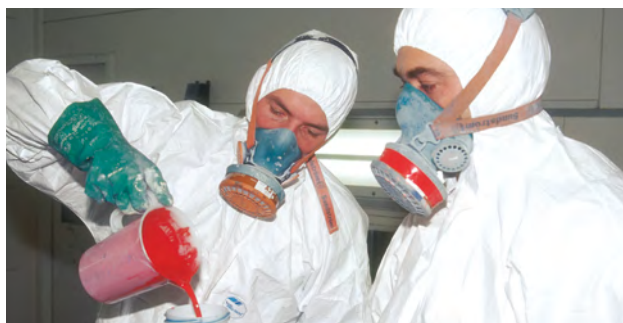
Unverzichtbar: Augenmaß, Erfahrung und Können.

Perfektes Ergebnis in Sicht. Vor dem Spritzlackieren werden gründliche Vorbereitungen geleistet. Dazu gehören das Demonstrieren von Beschlägen und Anbauteilen, gründliches Säubern und Entfetten, Abkleben, Schleifen und Grundieren. Die professionelle Druckluft-Spritzlackierung besteht aus mehreren Farbschichten. Diese werden jeweils mit der Spritzpistole aufgebracht und mehrere Stunden bei bis zu 50 °C getempert. So entsteht Schritt