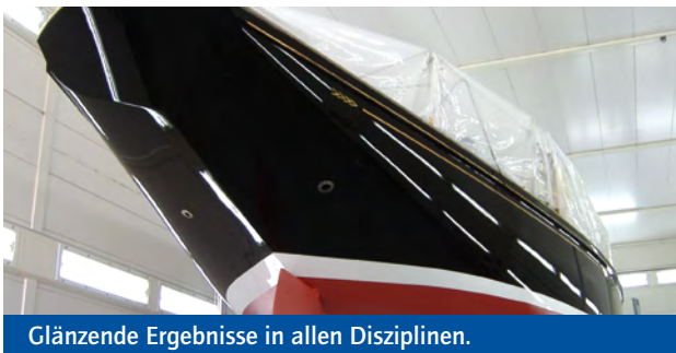
Glänzende Ergebnisse in allen Disziplinen.

für Schritt eine glänzende polyurethanlackierte Oberfläche – hart, glatt und glänzend. Sie konserviert die Schönheit Ihrer Yacht und sorgt so für einen langfristigen Werterhalt. Nach dem eigentlichen Lackiervorgang erfolgen die komplette Montage aller Beschläge und Anbauteile, die Beschriftung sowie das Aufriggen bis zur Übergabe der seeklaren Yacht.