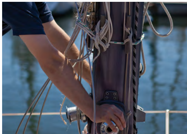
Jedes Detail passt, jeder Handgriff sitzt.

Wir reparieren, warten und inspizieren Außen- und Innenbordmotoren, Pumpen und Aggregate direkt bei Ihnen an Bord oder in unserer Motorenwerkstatt. Dank unserer optimalen Ersatzteilverversorgung für alle gängigen Fabrikate können wir eine schnellstmögliche Wiederinbetriebnahme Ihrer Yacht zusichern. Und falls Sie Fragen haben zur neu eingebauten Technik oder zu den Geräten, erklären wir Ihnen gern und verständlich die Handhabung.